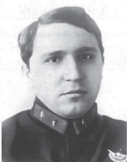
Комдив Медведев М.Е. Первый начальник МПВО с 1932 г. по 1934 г.