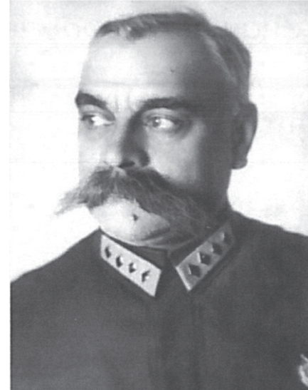
Командарм первого ранга Каменев С.С. Начальник управления ПВО РККА (МПВО) с 1934 г. по 1936 г.