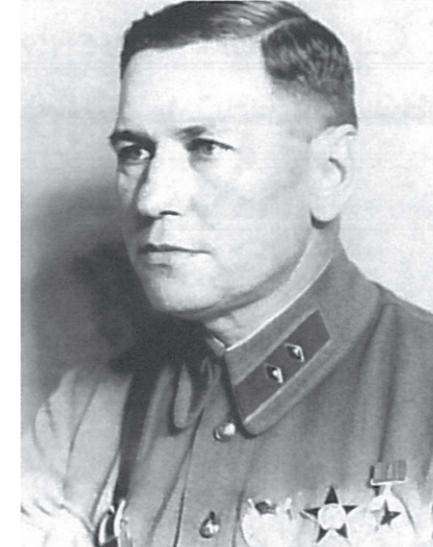
Генерал-лейтенант Осокин В.В. Начальник ГУ МПВО НКВД СССР с 1940 г. по 1950 г.

1937 – 1938 гг. – исполняющий обязанности начальника управления ПВО РККА комдив Блажевич И.Ф.