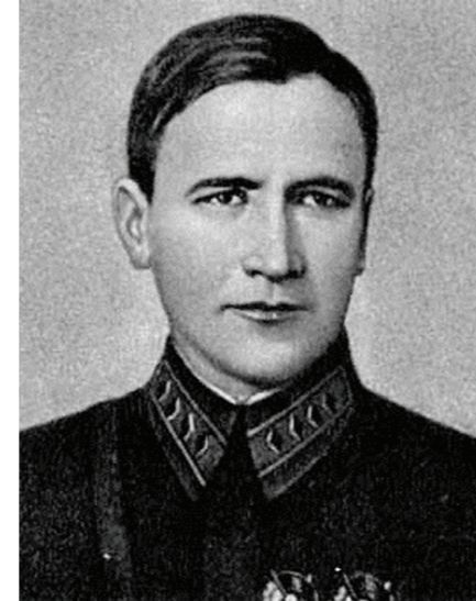
Командарм 2-го ранга Седякин А.И. Начальник управления ПВО РККА (МПВО)